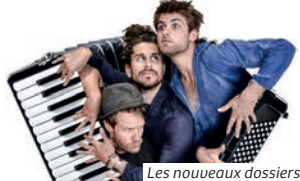
Les nouveaux dossiers